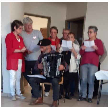
Petite troupe, pour une chanson avec les paroles modifiées sur l'air de « Mon Vieux » De D. Guichard.