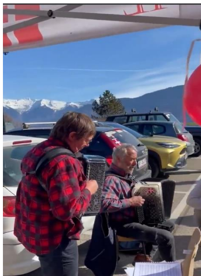
Nos amis Mauriennais à l'accordéon